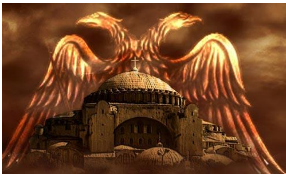
Ο κόσμος του Βυζαντίου

Η μετάβαση από τον αρχαίο κόσμο στον βυζαντινό έγινε σταδιακά. Οι δομές του αρχαίου κόσμου "πολιτικές, οικονομικές, θρησκευτικές" άρχισαν να κλονίζονται από το τέλος του 2ου αιώνα, εποχή κατά την οποία ο χριστιανισμός είχε αρχίσει να κερδίζει έδαφος και είχαν ήδη εμφανιστεί τα πρώτα δείγματα χριστιανικής τέχνης. Σταθμό για τη μετάβαση από τον κόσμο της αρχαιότητας στον κόσμο του Βυζαντίου αποτέλεσε η νομιμοποίηση της χριστιανικής θρησκείας το 313 από τον Μεγάλο Κωνσταντίνο. Η χριστιανική τέχνη απέκτησε στο εξής δημόσιο χαρακτήρα και τέθηκε στην υπηρεσία διάδοσης της νέας θρησκείας. Παράλληλα, η μεταφορά της έδρας της ρωμαϊκής αυτοκρατορίας από τη Ρώμη στην Κωνσταντινούπολη το 330 ήταν καθοριστική για τη μετατόπιση του κέντρου βάρους από τη λατινική Δύση στην εξελληνισμένη Ανατολή. Ο χωρισμός του ρωμαϊκού κράτους σε ανατολικό και δυτικό το 395 και η κατάλυση του δυτικού τμήματος το 476 αποτέλεσαν εξίσου σημαντικά ορόσημα για το τέλος του αρχαίου κόσμου, το οποίο συντελέστηκε οριστικά με το κλείσιμο των φιλοσοφικών σχολών κλασικής παιδείας το 529, την έναρξη των βαρβαρικών επιδρομών και την παρακμή των μεγάλων αστικών κέντρων μετά τον 6ο αιώνα.