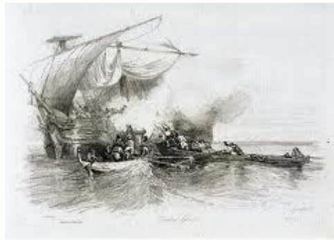
Ελληνες Πειρατές National Maritime Museum Alexandre Decamps Gabriel

Η πειρατεία στον αρχαίο μεσογειακό κόσμο αποτελεί την αρχαιότερη καταγεγραμμένη εμφάνιση του φαινομένου της πειρατείας, δηλαδή της καταλήστευσης πλοίων και πόλεων από ένοπλες ναυτικές ομάδες. Ξεκινώντας από αλασγικές, αιγυπτιακές και ουγκαριτικές πηγές της 2ης π.Χ. χιλιετίας, περνώντας απ' τον Όμηρο, τον Ηρόδοτο, το Θουκυδίδη και φτάνοντας ως το Λίβιο και τον Πλούταρχο, οι περισσότεροι συγγραφείς της αρχαιότητας ασχολήθηκαν με τα έργα και τις ημέρες των πειρατών.