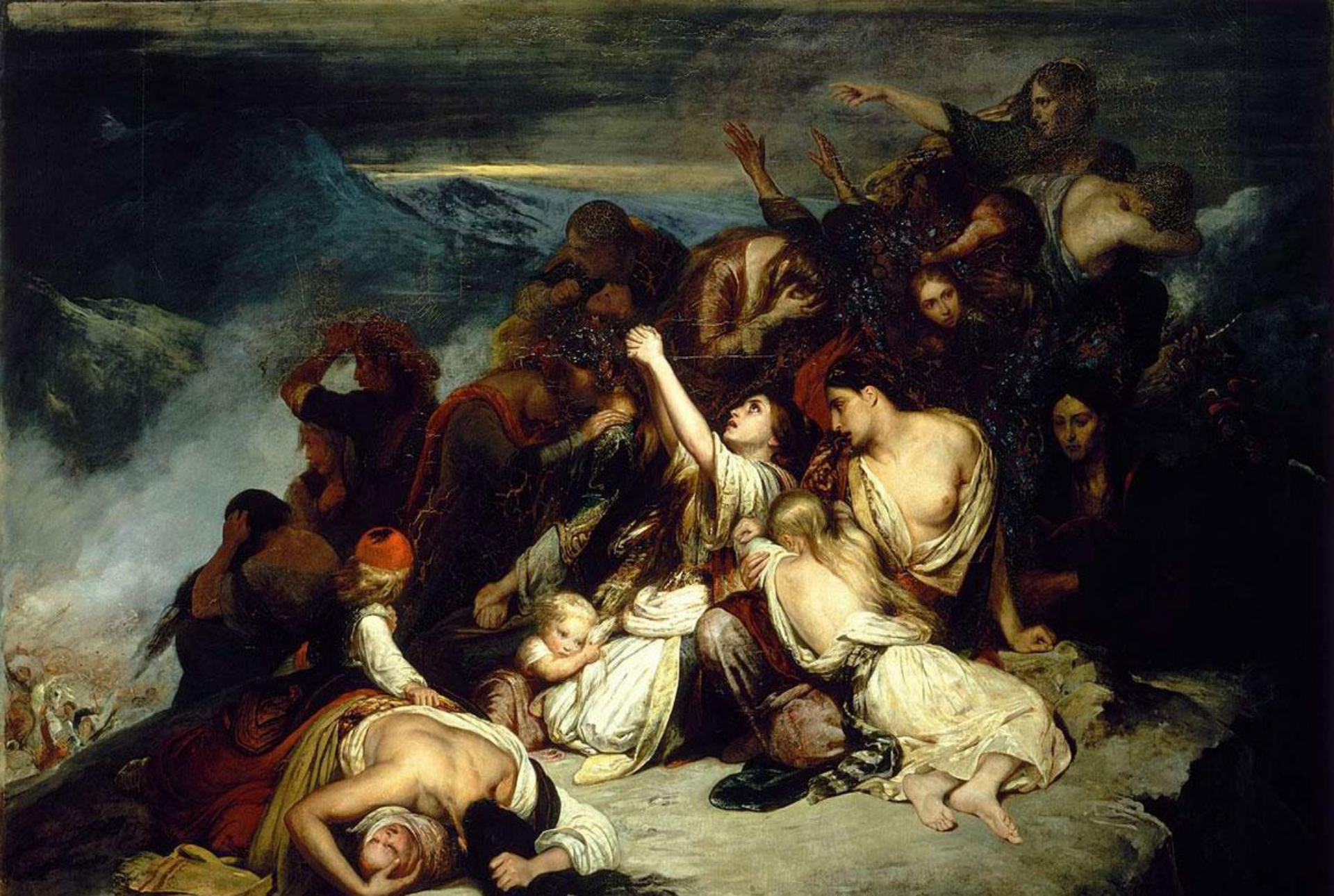
Ary Scheffer, Les femmes souliotes (Οι Σουλιώτισσες), 1827. Μουσείο του Λούβρου.