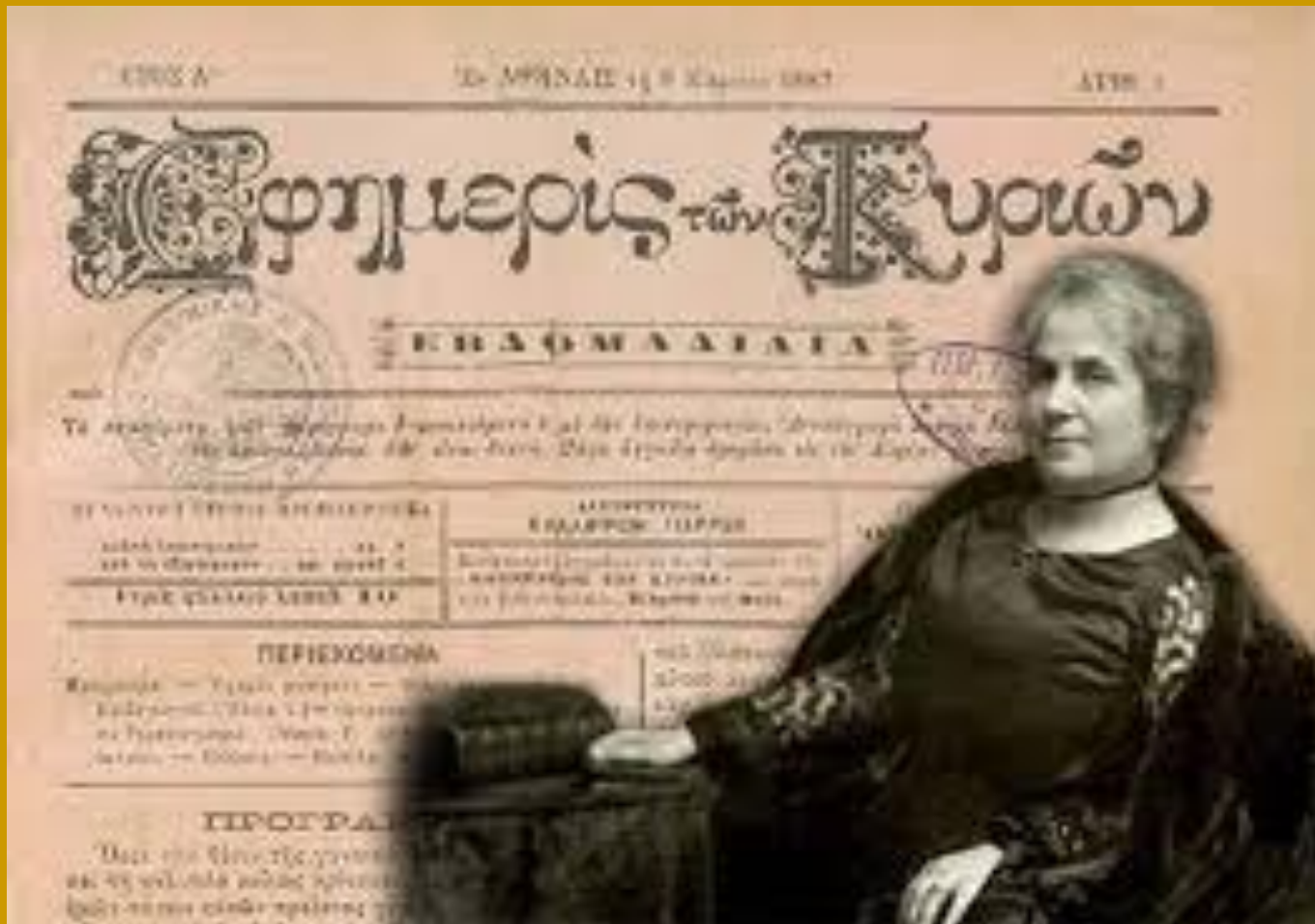
Γυναικεία εφημερίδα, το πρώτο φύλλο της οποίας κυκλοφόρησε στις 8 Μαρτίου 1887