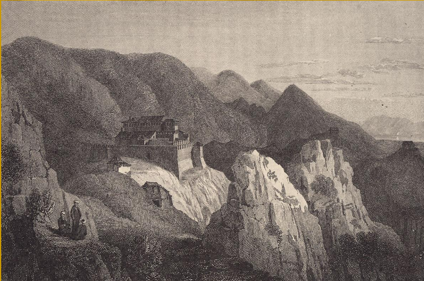
Το ορεινό Σούλι, Αθήνα, Πολεμικό Μουσείο