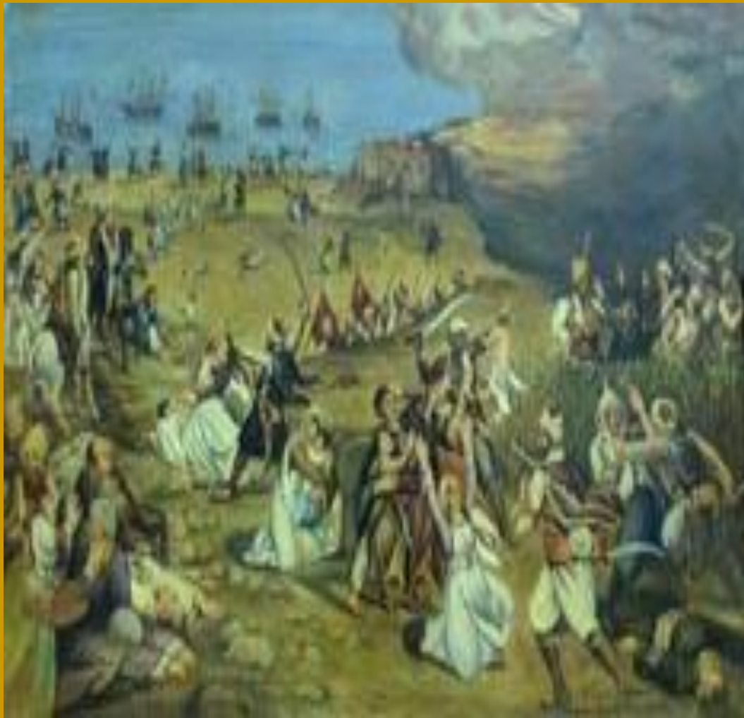
Γκραβούρα από τη σφαγή της Χίου