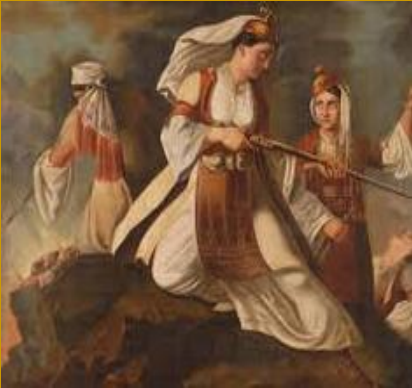
Μόσχω Λάμπρου Τζαβέλα 19