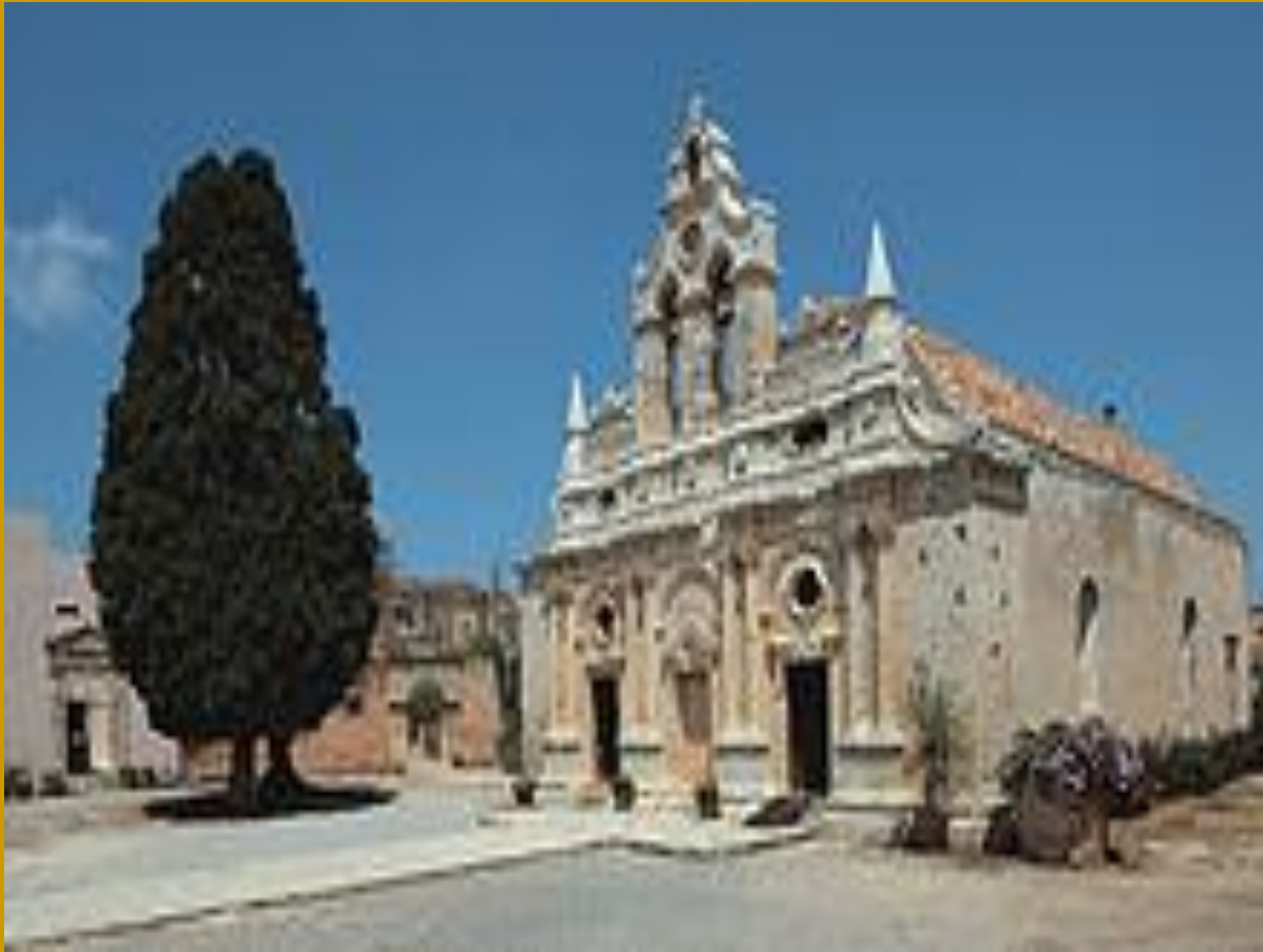
Η Μονή Αρκαδίου σήμερα