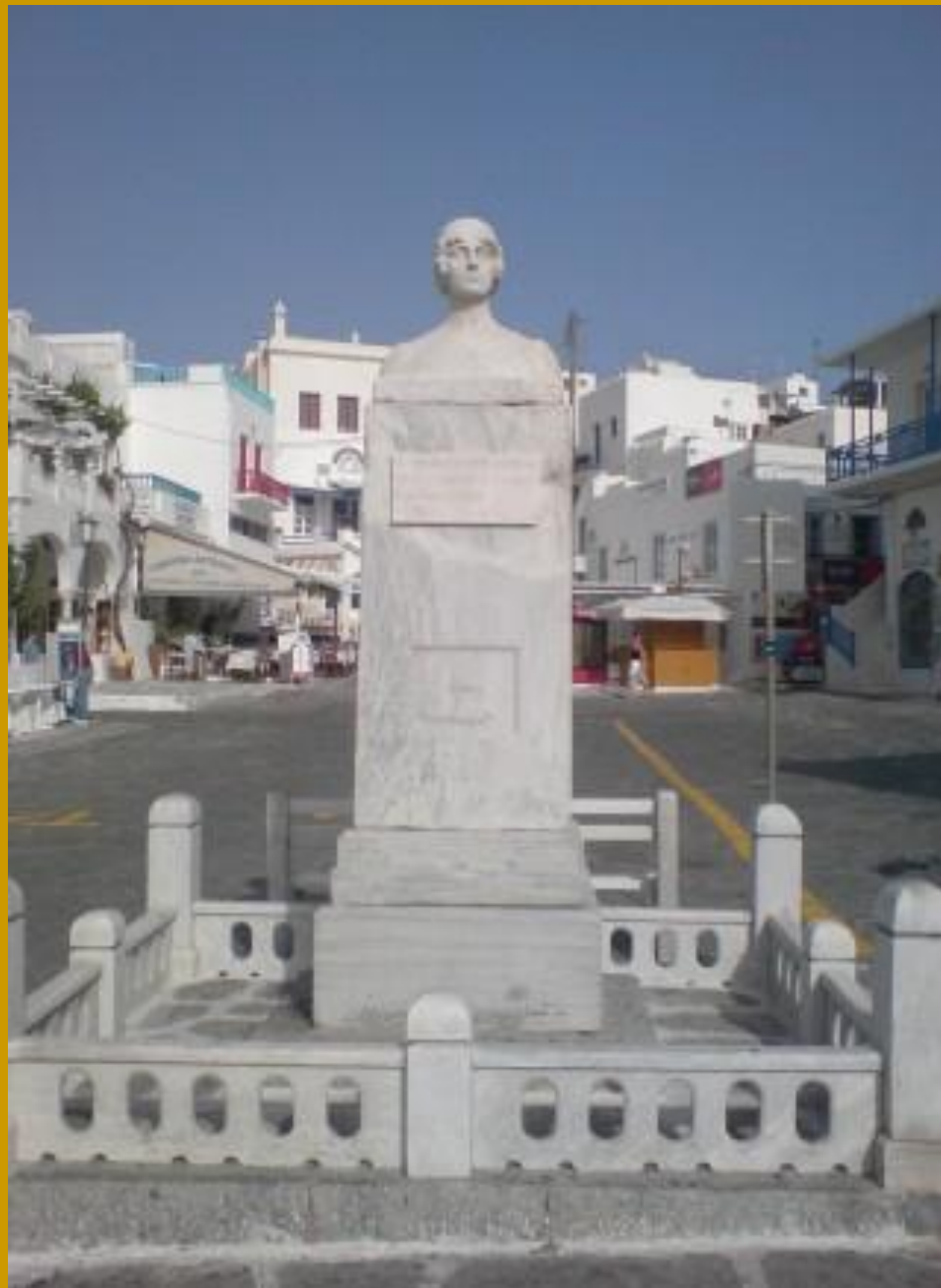
ΠΡΟΤΟΜΗ ΤΗΣ ΜΑΝΤΩ ΜΑΥΡΟΓΕΝΟΥΣ 12