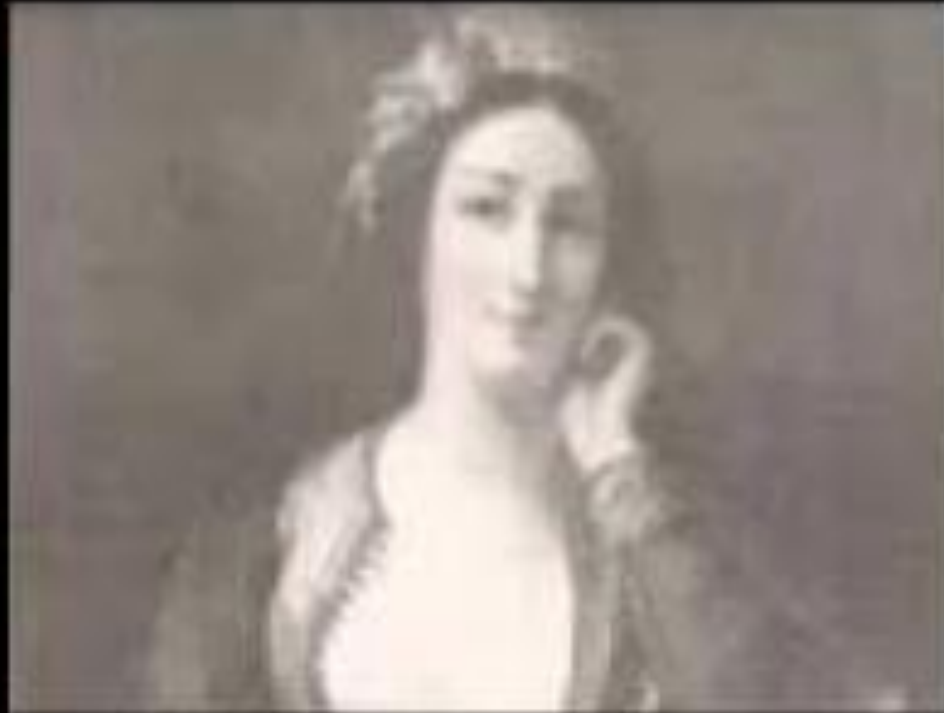
ΤΖΑΒΕΛΑΙΝΑ: Η ΓΥΝΑΙΚΑ ΣΥΜΒΟΛΟ ΣΤΗ ΙΣΤΟΡΙΑ ΤΗΣ ΕΛΛΑΔΑΣ