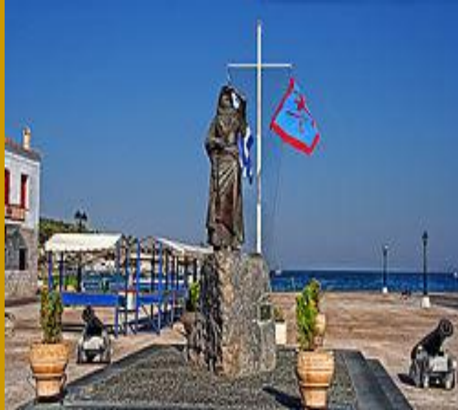
Άγαλμα της Μπουμπουλίνας στις Σπέτσες