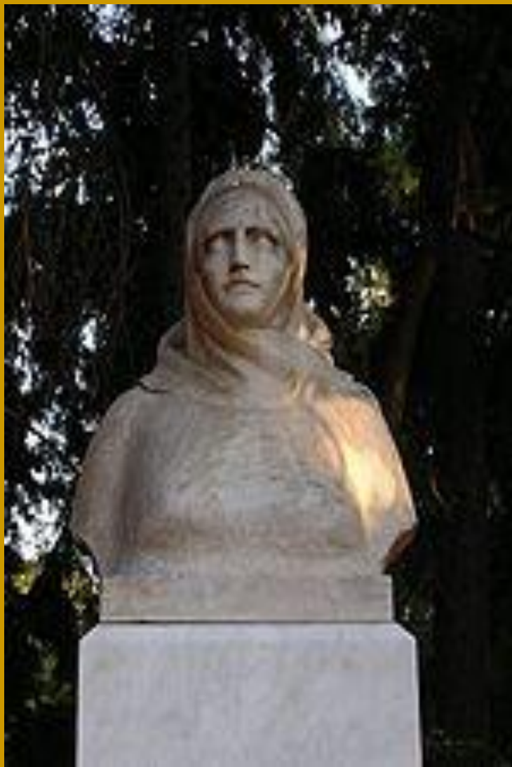
Προτομή της Μπουμπουλίνας στο Πεδίο του Άρεως