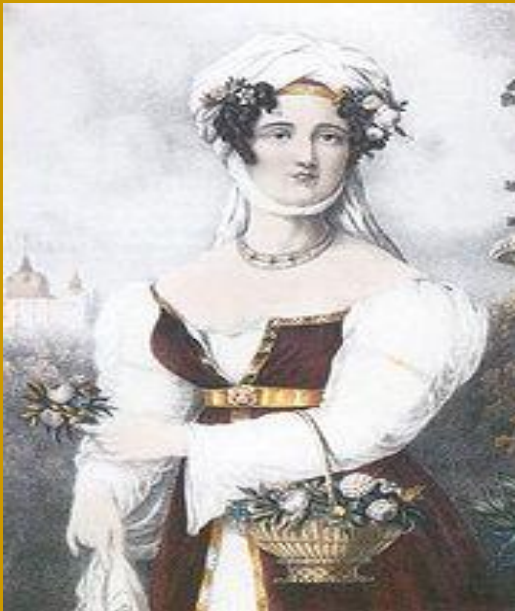
Πίνακας του 1827 από τον Adam de Friedel που απεικονίζει την Μπουμπουλίνα